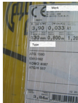
Foto van de isolatiedikte en foto van het etiket op de aangeleverde isolatie waaruit merk en type duidelijk worden. Wanneer mogelijk in combinatie met plaats van levering (bouwplaats).

De dikte van isolatiemateriaal kan worden vastgelegd door een duimstok op de foto mee te fotograferen. Op de foto moet duidelijk zijn dat de duimstok aanligt tegen de binnenwand en dat de duimstok loodrecht op de dikte van het isolatiemateriaal staat.